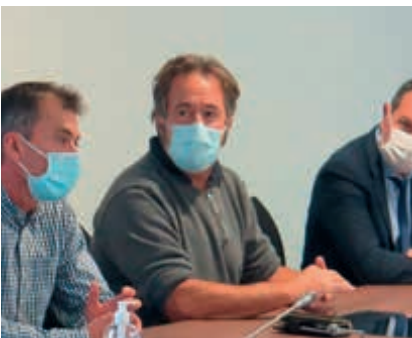
Conférence de presse "Centre de Santé" - novembre 2020.