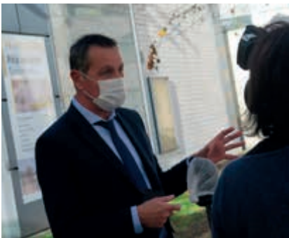
Présentation à la presse du Pôle de Santé - novembre 2020.