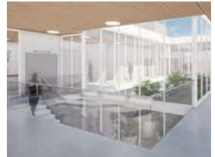
Vue intérieure du Pôle de Santé Simone Veil

L'aménagement de ce vaste bâtiment a été dessiné avec les professionnels de santé qui ont pu exprimer leurs besoins et contraintes. Ils pourront ainsi profiter d'un lieu accessible à tous et adapté à leurs activités.