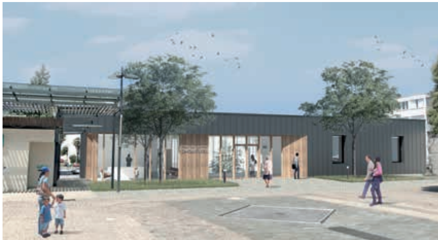
Vue depuis la Place du Béarn

Pour répondre à la demande, la ville a transformé son projet initial : le Pôle de Santé occupera désormais les deux niveaux de ce bâtiment grâce à la création d'un puit de lumière au centre.